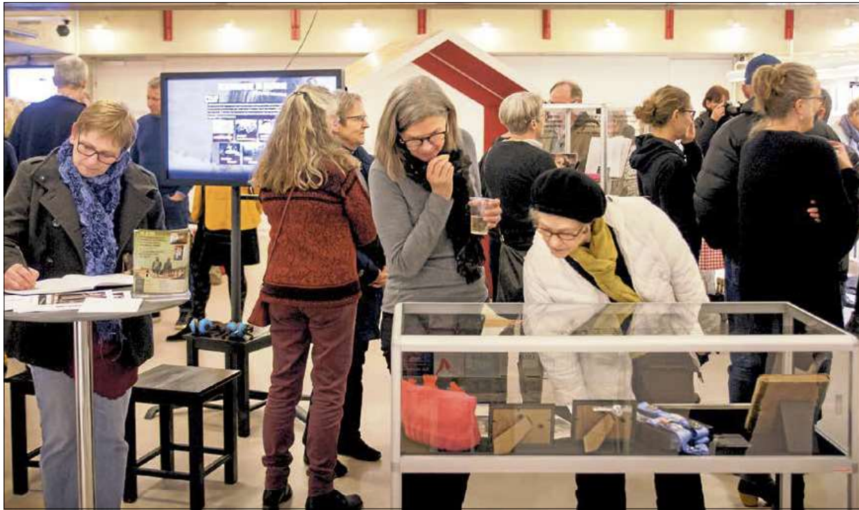
Børnebamses og dagbøger fra voldsramte kvinder er blandt udstillingens genstande. De blev grundigt betragtet ved åbningen.